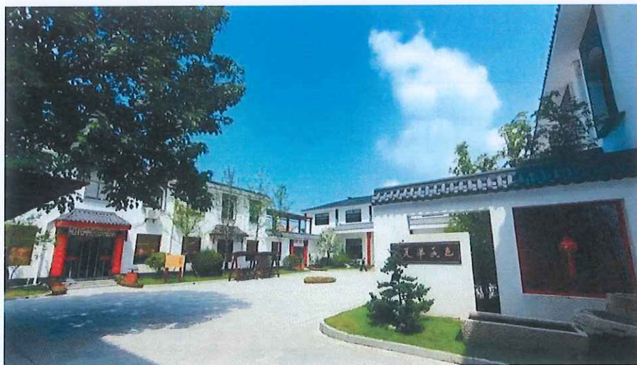
马庄村红色教育基地

马庄村，隶属于江苏省徐州市贾汪区潘安湖街道办事处，全村区域总面积5.2平方公里。享有千年古村之美誉，在北宋真宗年间已经成为村落，2017年12月习总书记徐州考察来到此地与村民交流。马庄村景色优美宜人，矿藏水能蕴藏丰富，土地肥沃水草丰茂，森林密布植被良好，飞禽走兽种类繁多，五省通衢的舟楫之利，浸润着这篇土地深厚蓬勃的历史底蕴。雄伟的京杭大运河日夜奔流，青山叠翠，绿水微澜，一泓泓清流韵律，是马庄村生态蝶变的最美诠释。